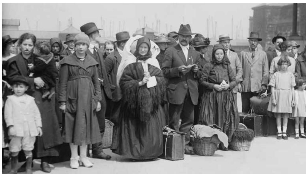
År 1887 hade Sverige sin allra största utvandring. Under året lämnade 50 786 invånare Sverige.